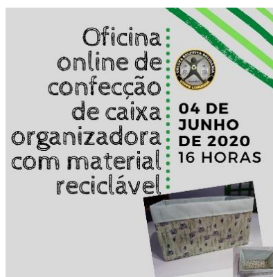
Figura 1- Arte de divulgação da Oficina online de confecção de caixa organizadora com material reciclável

do Meio Ambiente na UTFPR-LD, elaborado pela CGRS.